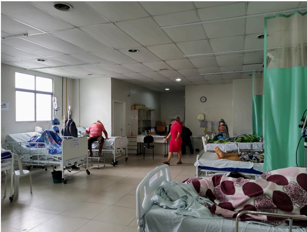
Sala amarela com pacientes internados aguardando leito de retaguarda