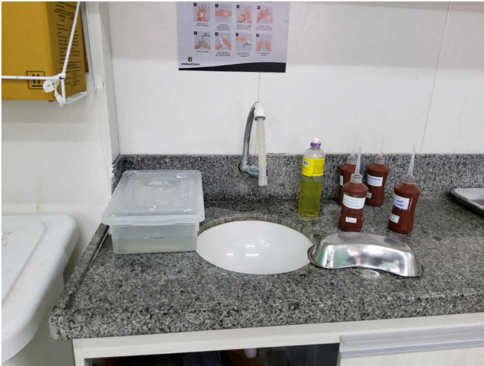
Lavabo da sala vermelha sem acionamento automático