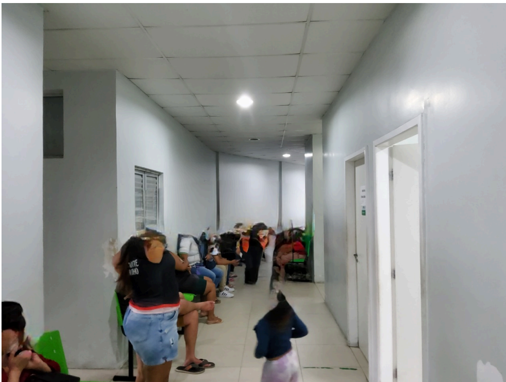
Observar quantidade de pessoas aguardando atendimento