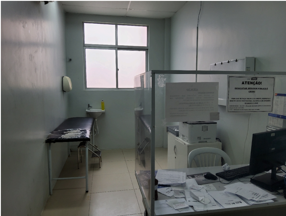
Consultório da clínica médica