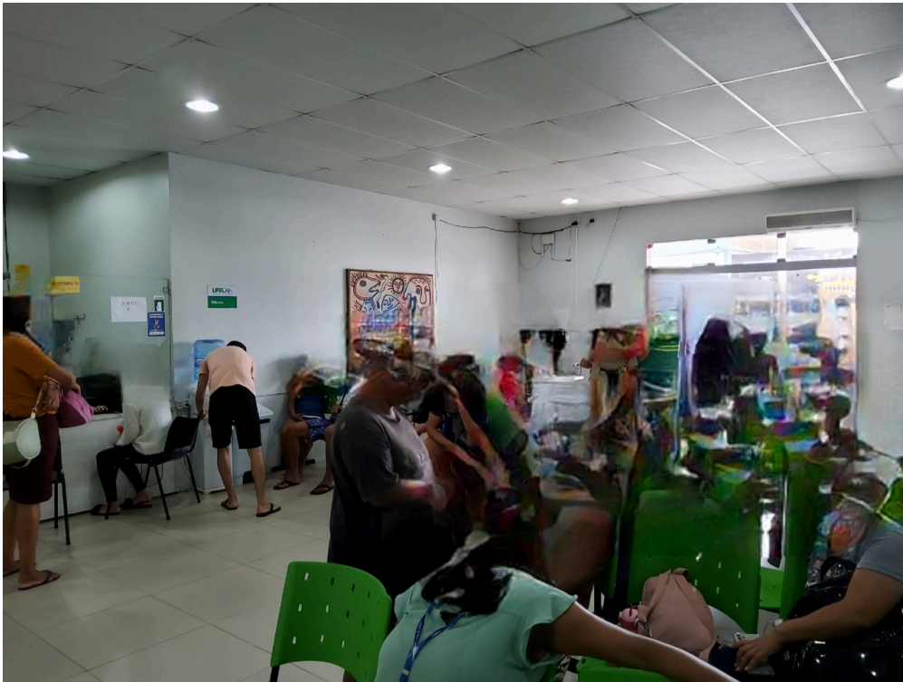
Recepção e sala de espera