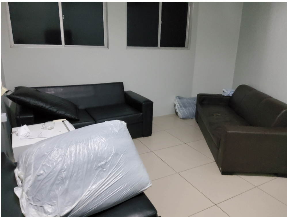
Sala de estar dos profissionais