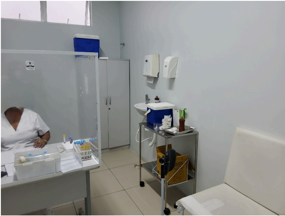
Sala de coleta