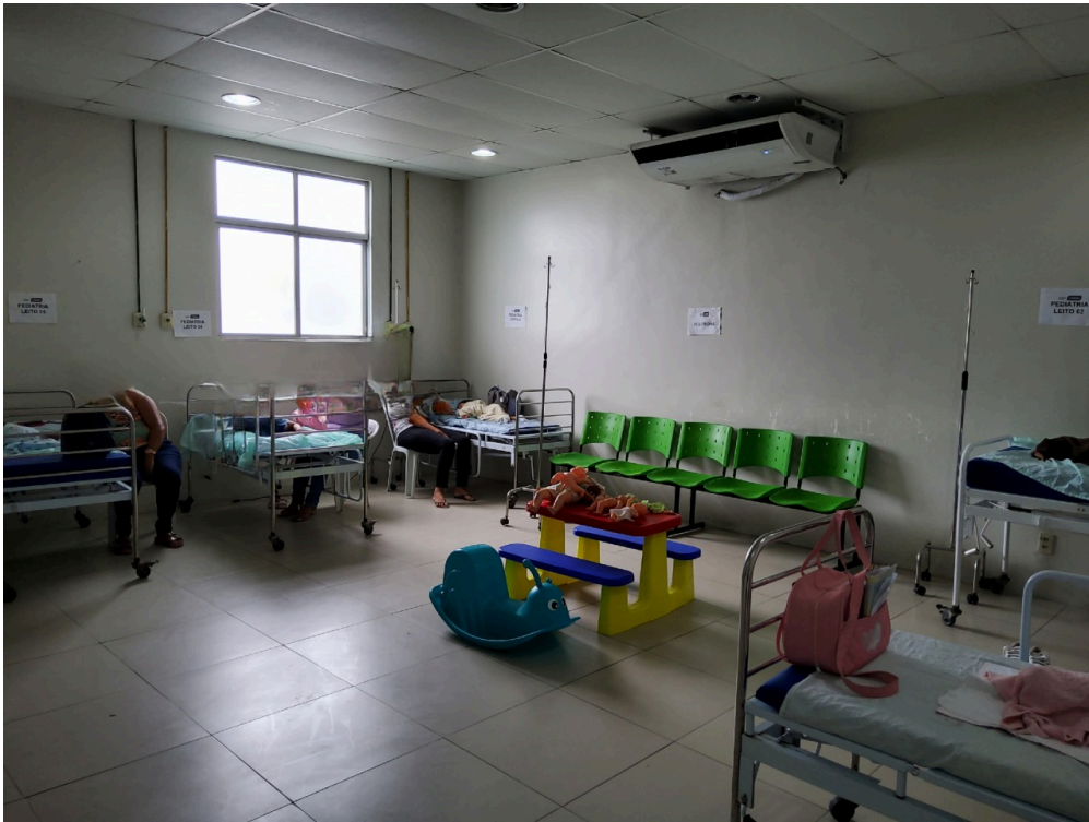
Sala de observação pediátrica (foto 1)