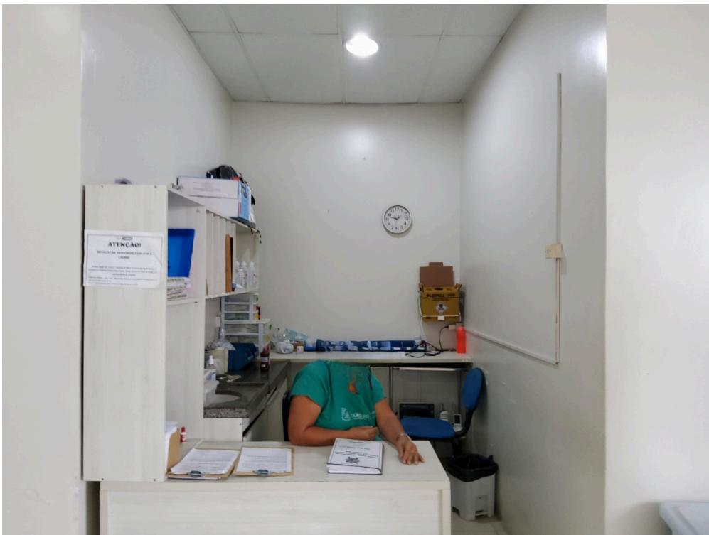
Sala de observação pediátrica (foto 2)