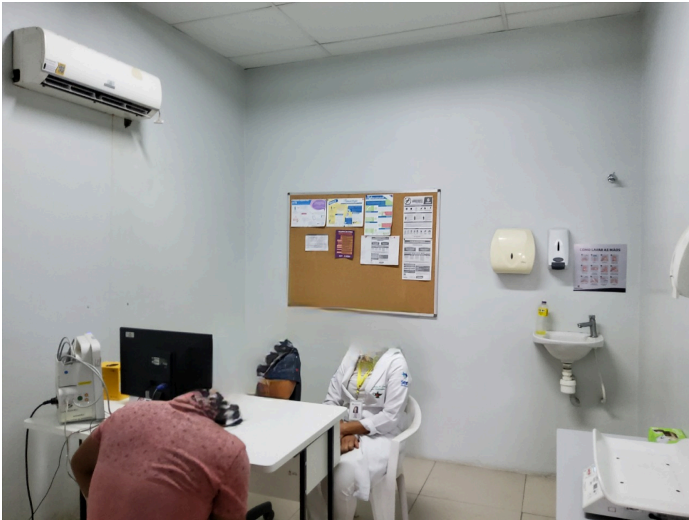
Classificação de risco