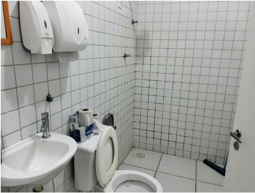
Banheiro do repouso masculino