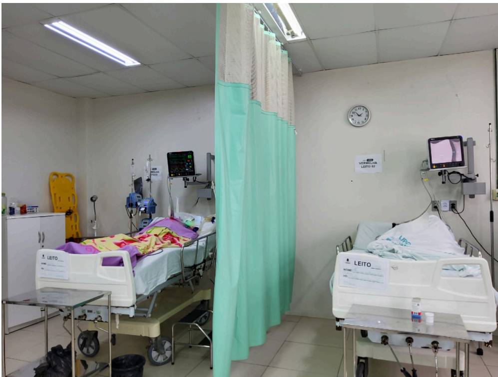
Sala vermelha (foto 2)