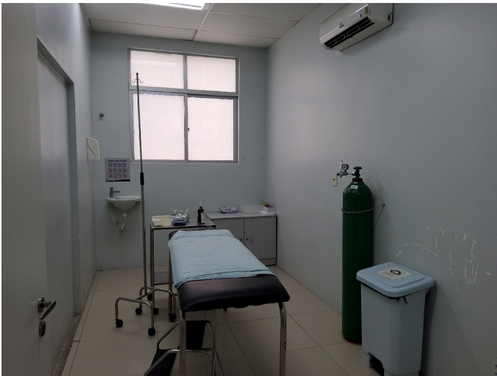
Sala de medicação da pediatria