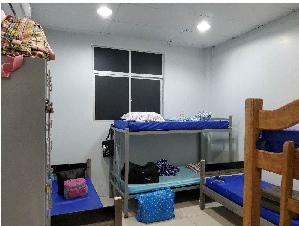
Repouso nível superior feminino