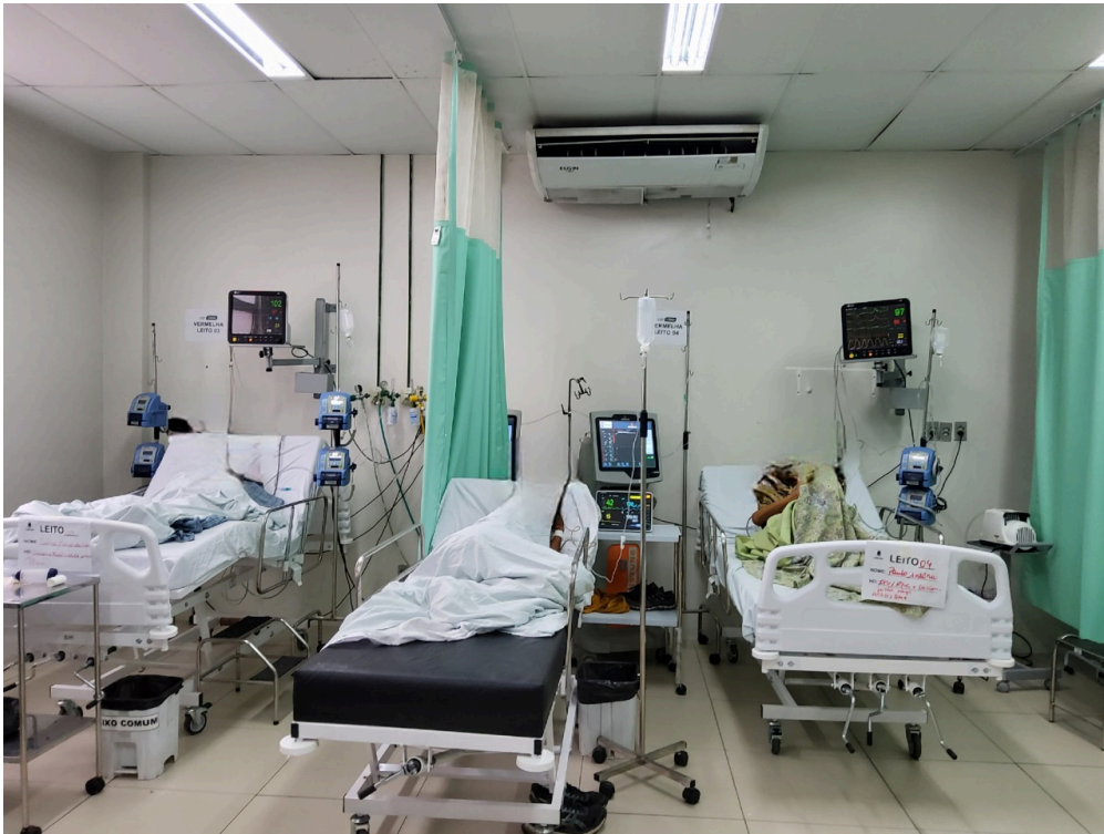
Sala vermelha com leito extra