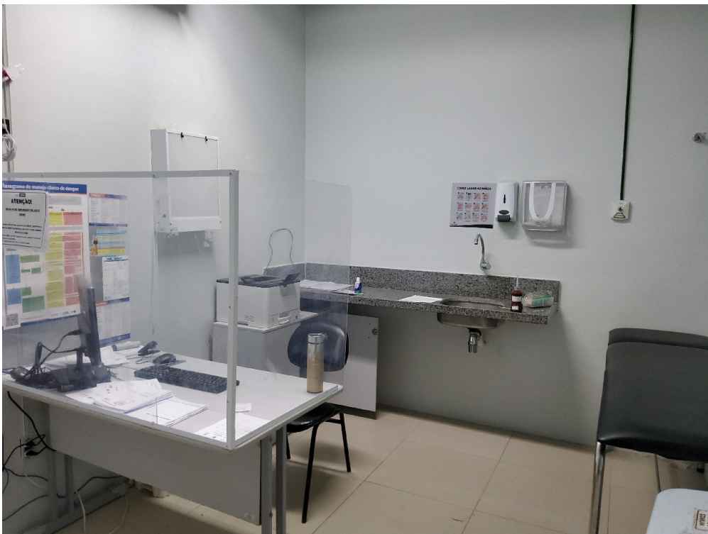
Consultório da pediatria