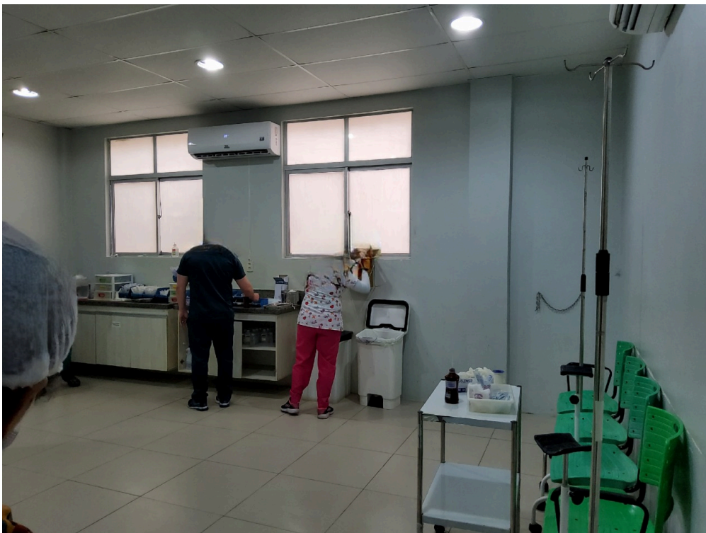
Sala de medicação (foto 1)