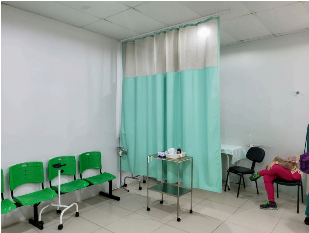
Sala de medicação (foto 2)