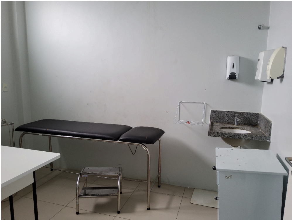
Sala de procedimentos