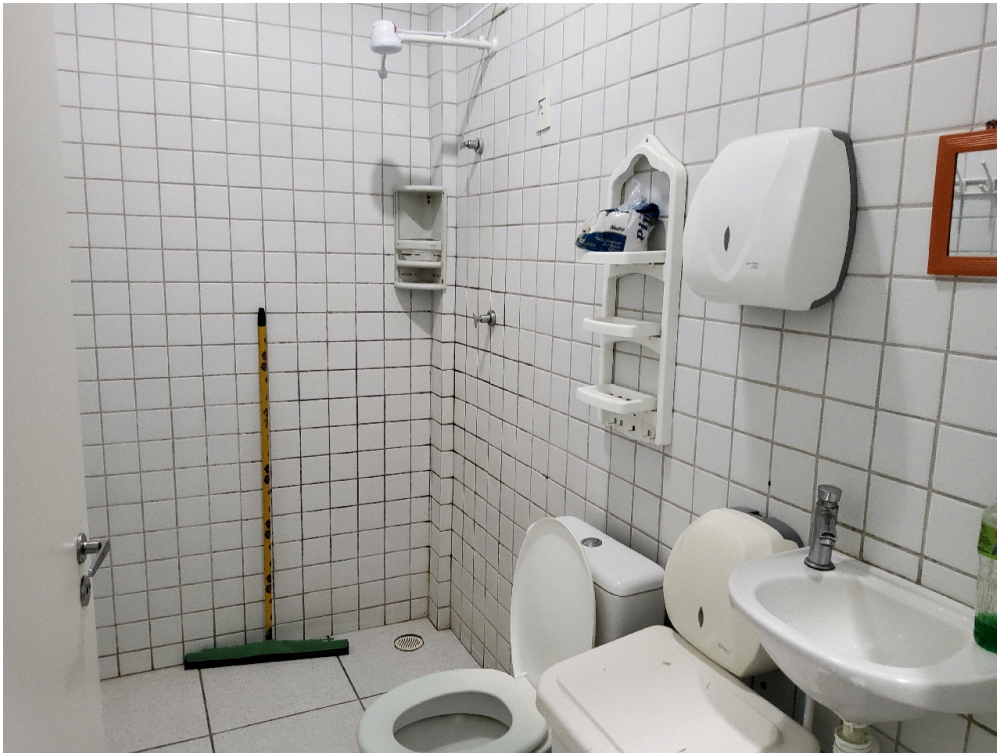
Banheiro do repouso feminino