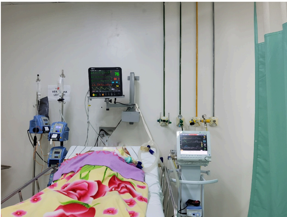
Paciente intubado aguardando leito de UTI há mais de 72h