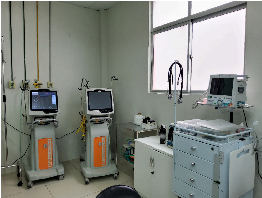
Sala vermelha (foto 3)