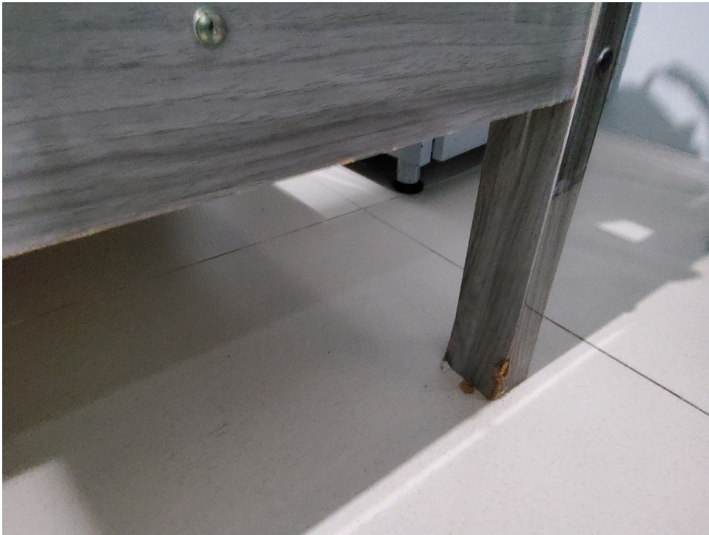
Avarias na cama do repouso masculino