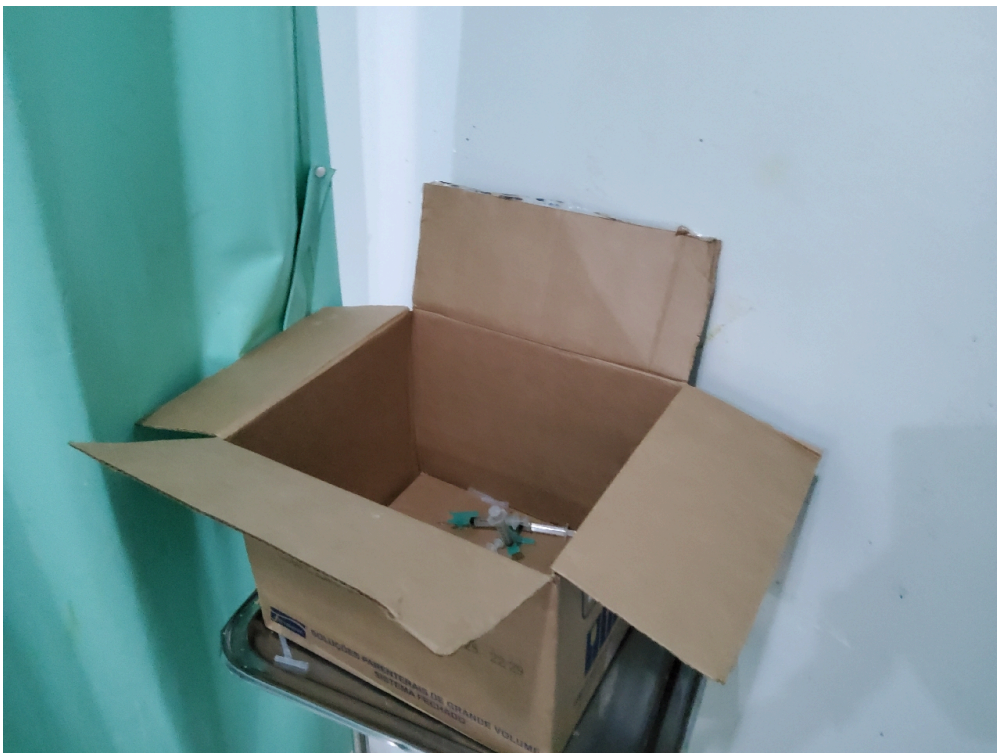
Caixa utilizada para pérfurocortantes