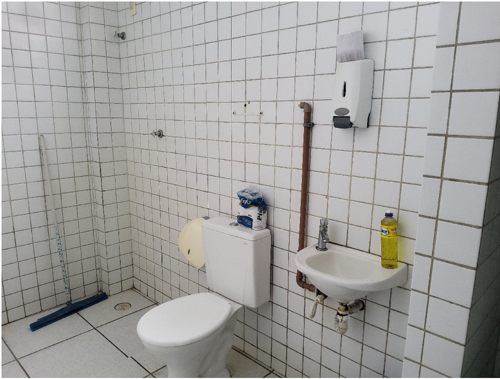
Banheiro da sala de observação pediátrica