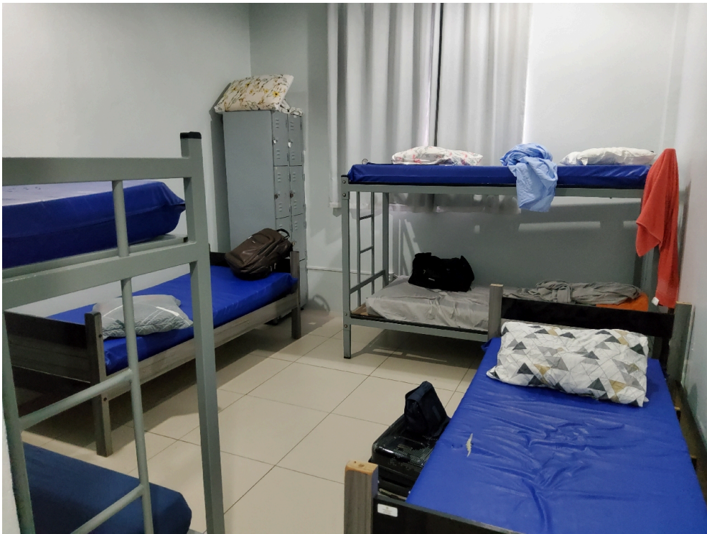
Repouso nível superior masculino