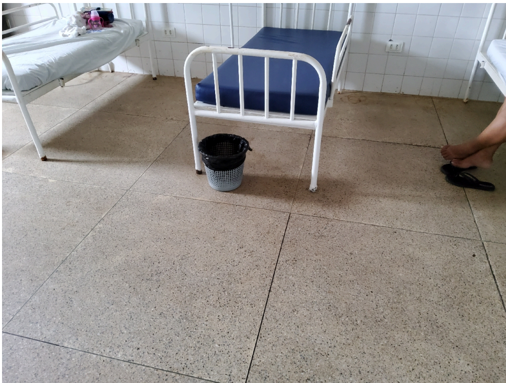
Respeita distância entre leitos paralelos = 1m