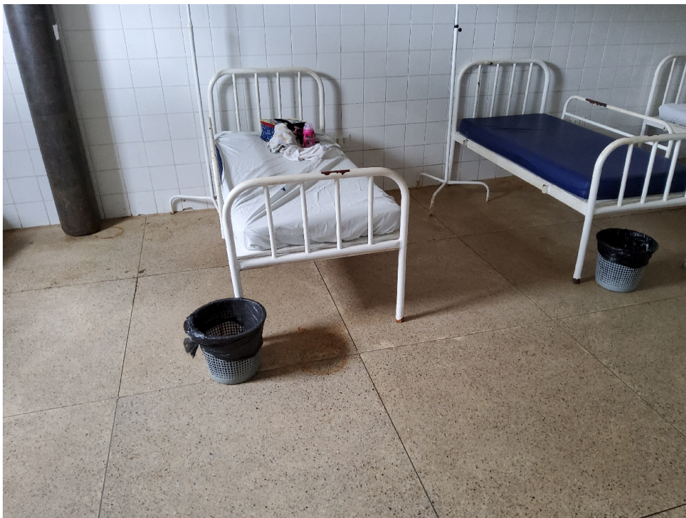
Poltrona de acompanhante ao lado do leito