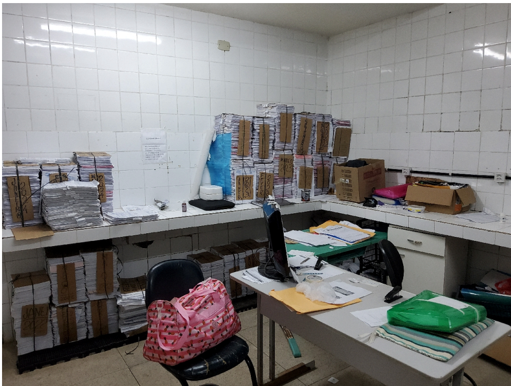
Serviço de Arquivo Médico e Estatística – SAME