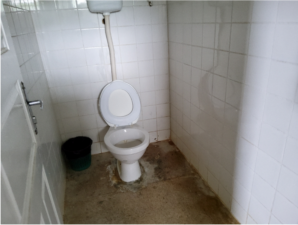
Cada quarto ou enfermaria tem acesso direto a um banheiro