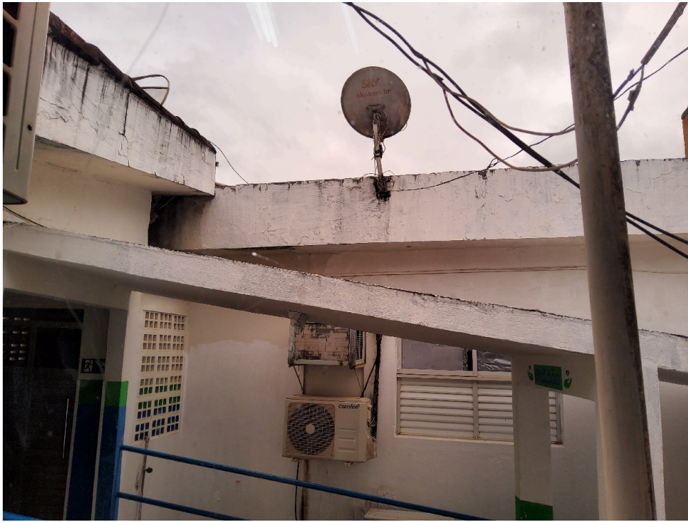
Instalações livres de trincas, rachaduras, mofos e/ou infiltrações