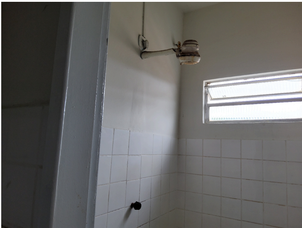
Cada quarto ou enfermaria tem acesso direto a um banheiro