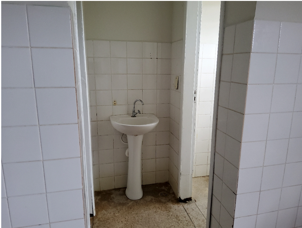
Cada quarto ou enfermaria tem acesso direto a um banheiro