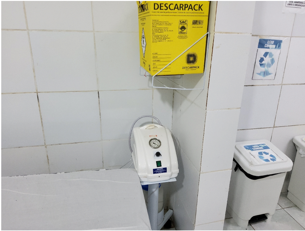
Aspirador de secreções