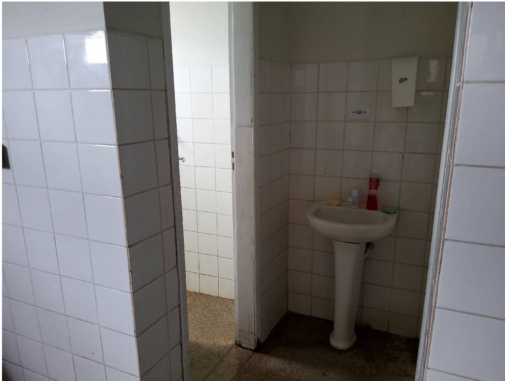
Cada quarto ou enfermaria tem acesso direto a um banheiro