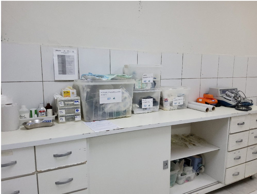
Conta com, no mínimo, duas macas/leitos