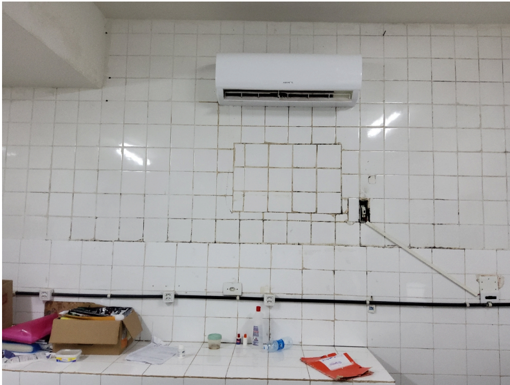
Serviço de Arquivo Médico e Estatística – SAME