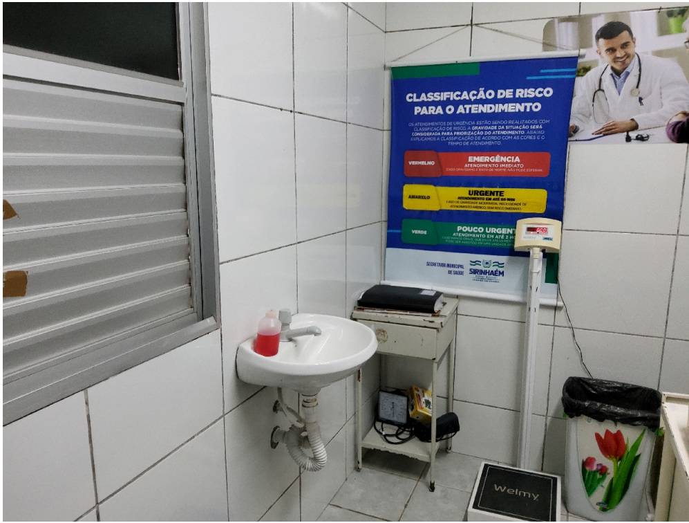
Há Acolhimento com Classificação de Risco