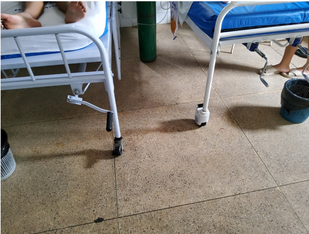
Respeita o máximo de seis (06) leitos por enfermaria