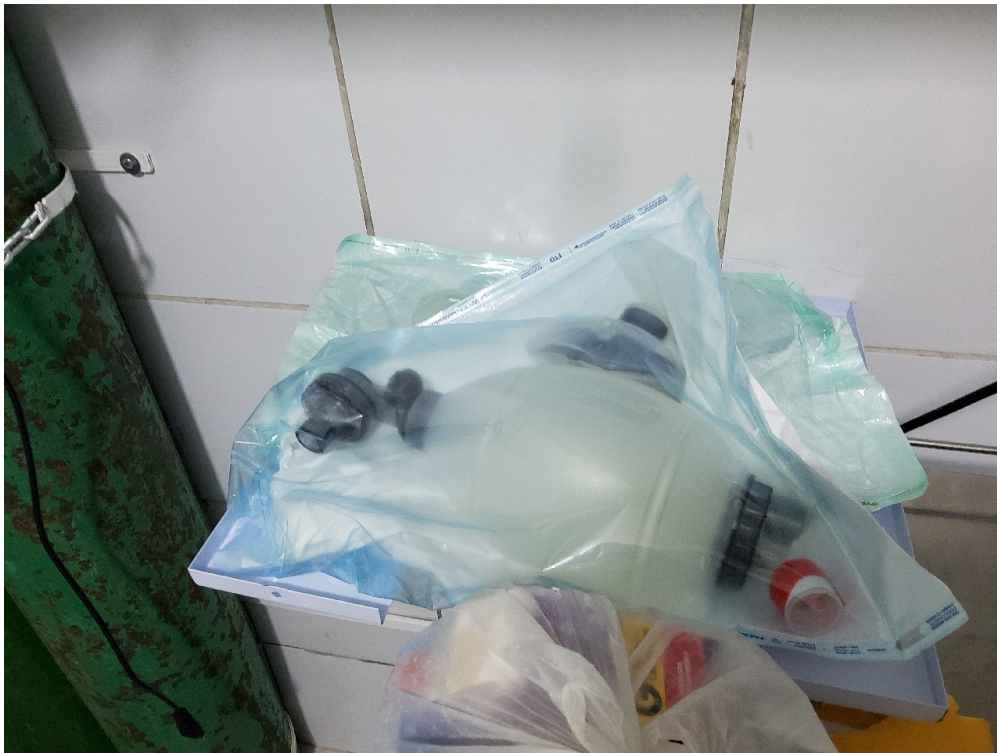
Ressuscitador manual do tipo balão auto inflável com reservatório e máscara