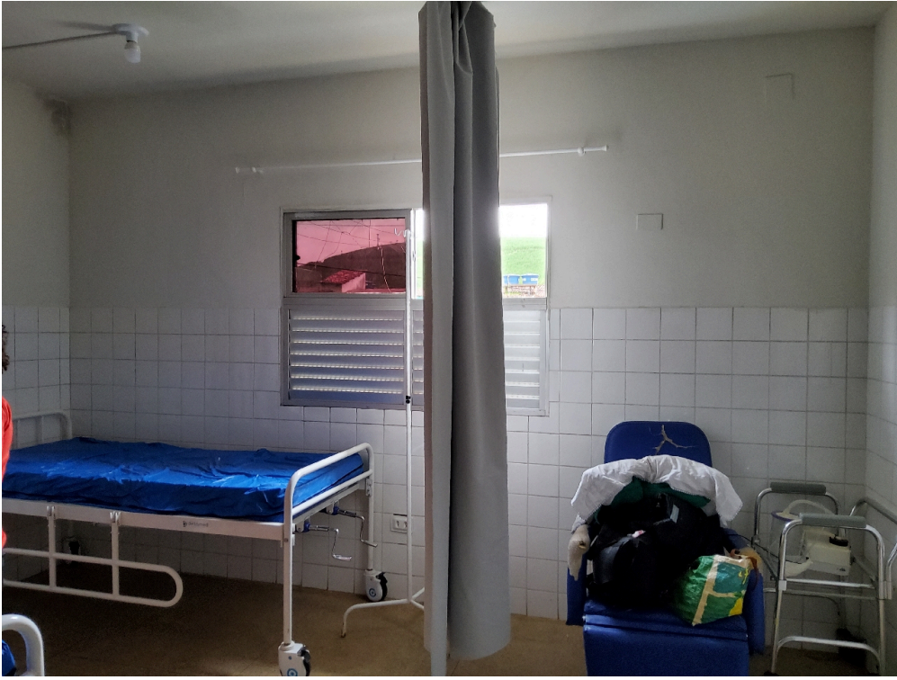
Respeita o máximo de seis (06) leitos por enfermaria