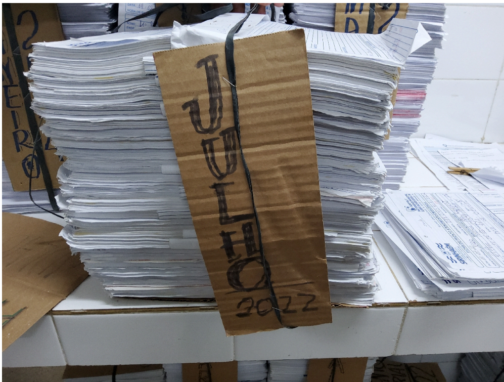
Serviço de Arquivo Médico e Estatística – SAME