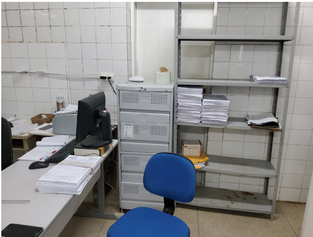
Serviço de Arquivo Médico e Estatística – SAME