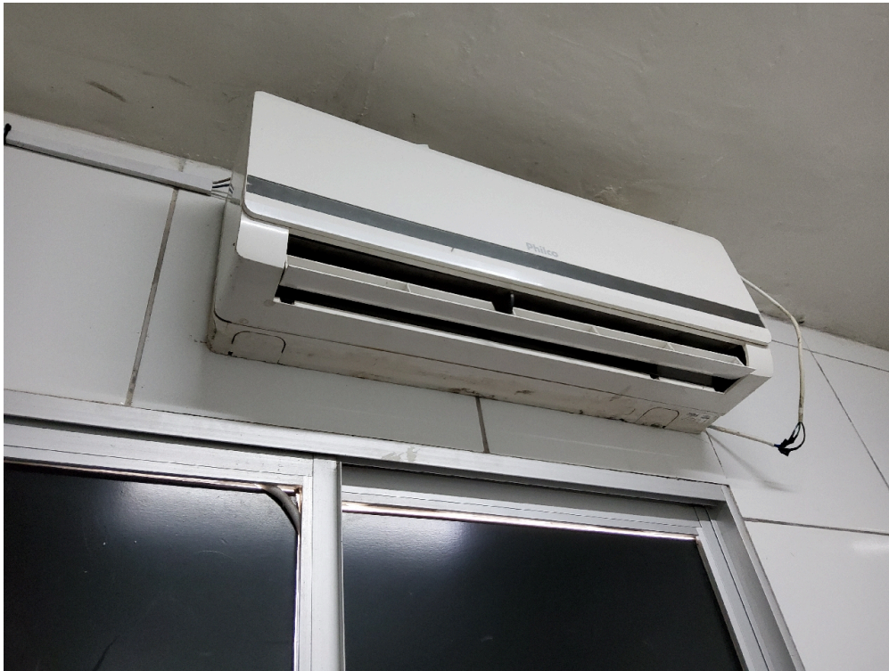
Há Acolhimento com Classificação de Risco