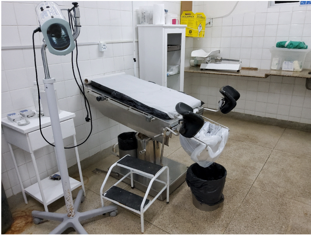
Mesa de parto