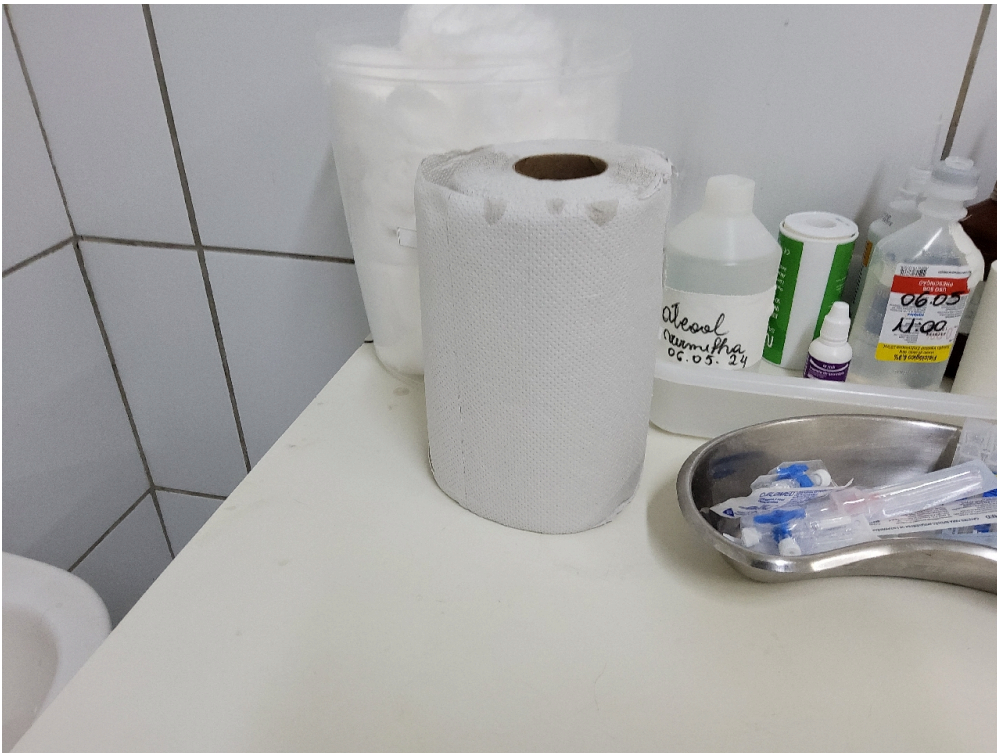
Toalhas de papel