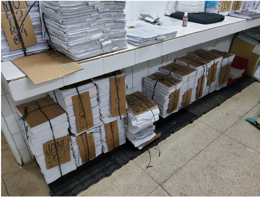
Serviço de Arquivo Médico e Estatística – SAME