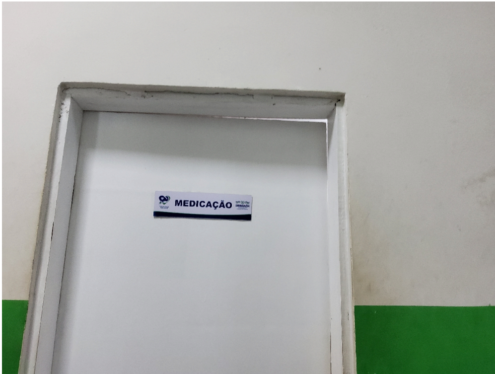
Sala de Medicação