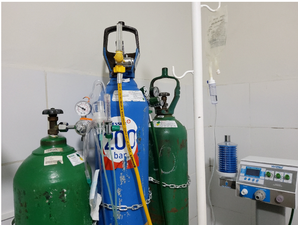
Conta com, no mínimo, duas macas/leitos