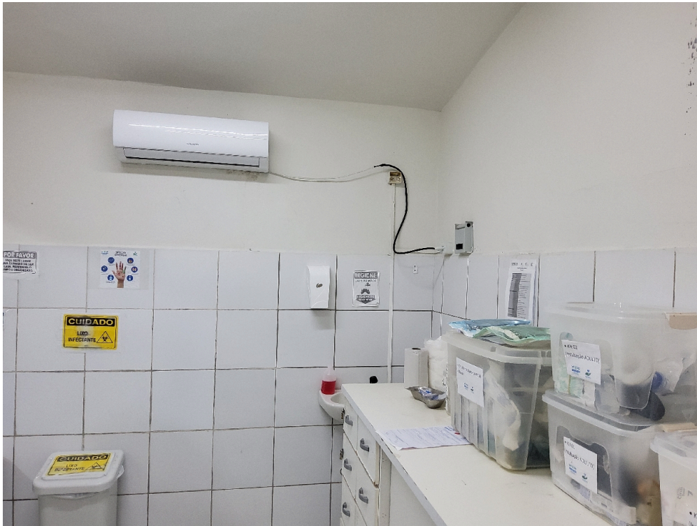
Conta com, no mínimo, duas macas/leitos