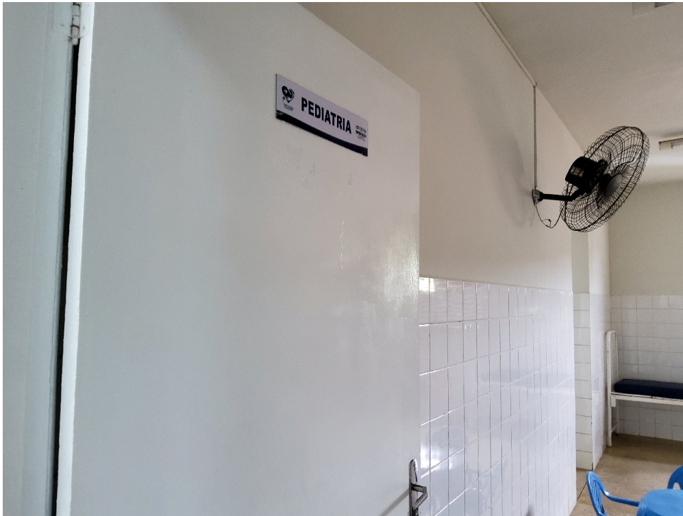
Respeita área mínima de 6m 2 /leito para enfermaria de 3 a 6 leitos