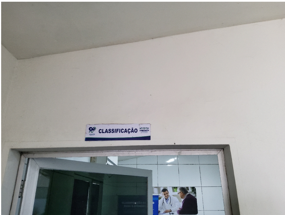
Há Acolhimento com Classificação de Risco