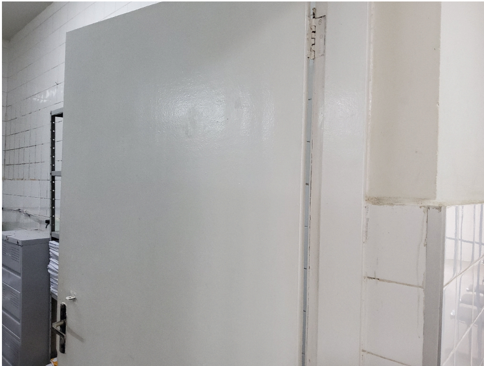
Serviço de Arquivo Médico e Estatística – SAME