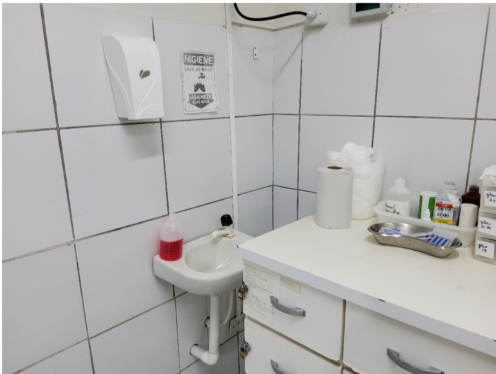
Pia com água corrente