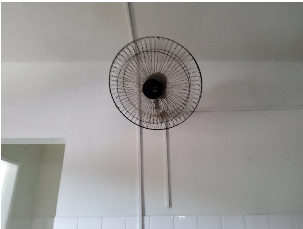
Ambiente com conforto térmico