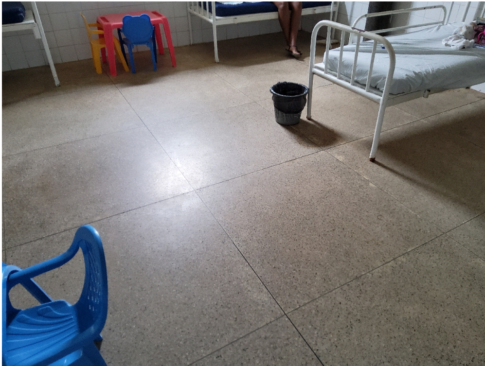
Respeita distância entre leitos paralelos = 1m