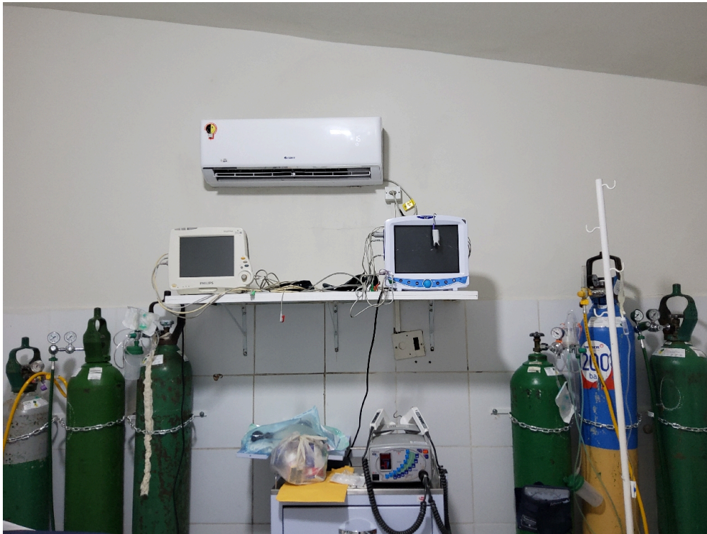
Conta com, no mínimo, duas macas/leitos