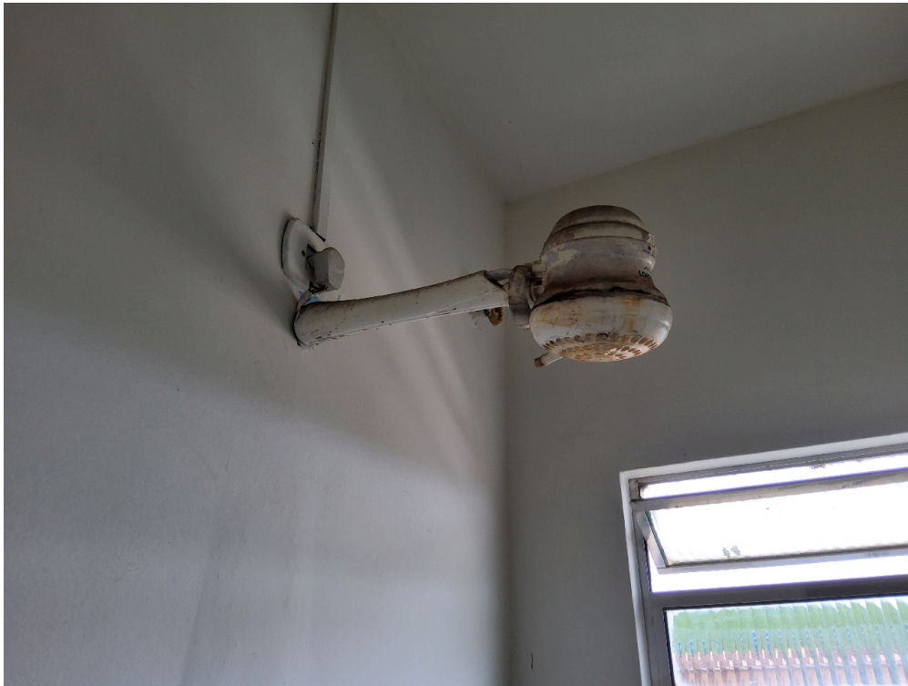
Cada quarto ou enfermaria tem acesso direto a um banheiro