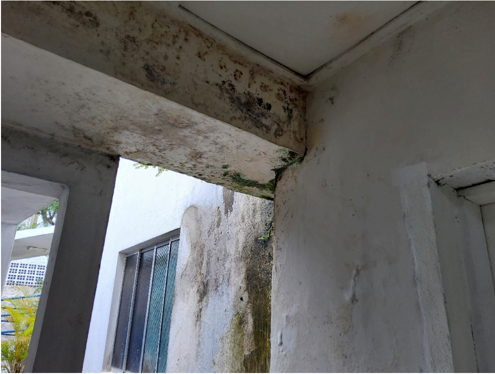
Instalações livres de trincas, rachaduras, mofos e/ou infiltrações