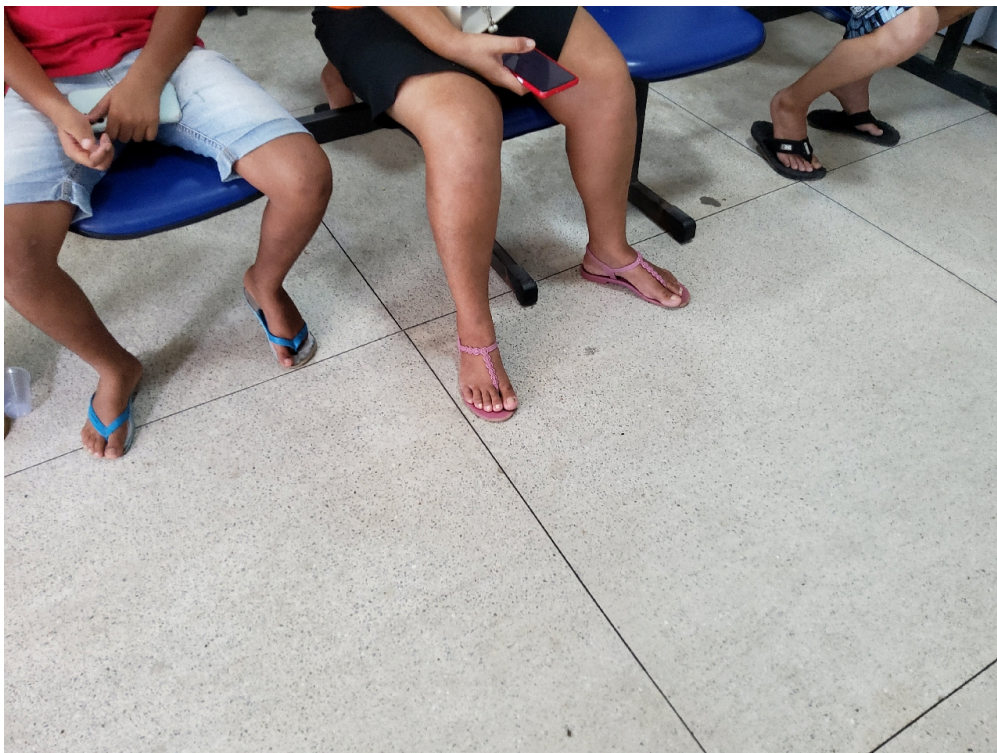
Há mais de 50.000 atendimentos/ano no setor