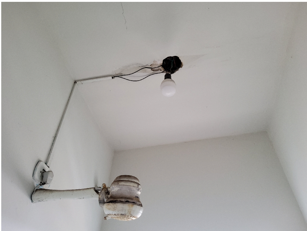
Cada quarto ou enfermaria tem acesso direto a um banheiro