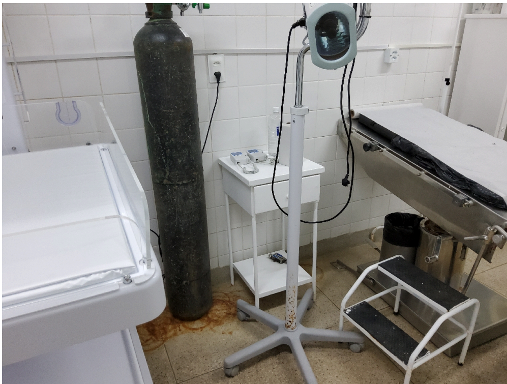
Item não conforme: Fixo à parede ou em suporte apropriado para tal