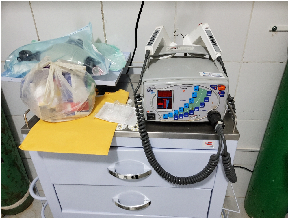
Item não conforme: Desfibrilador com monitor