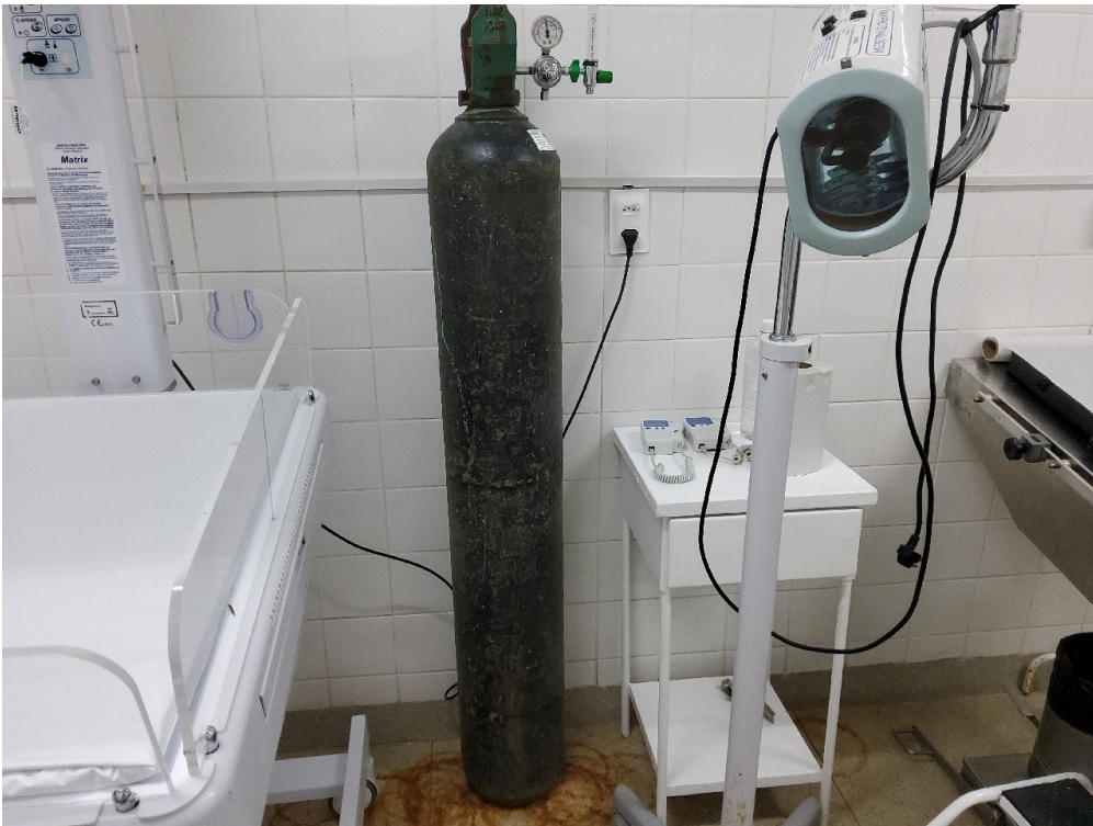
Fonte de oxigênio medicinal