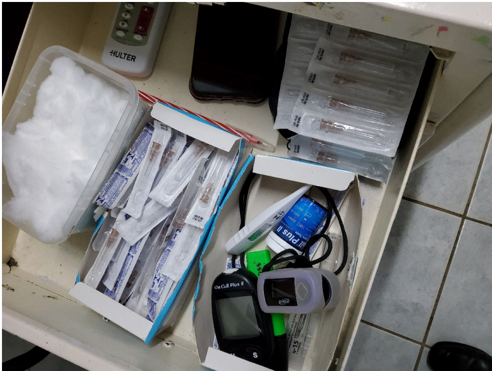
Há Acolhimento com Classificação de Risco