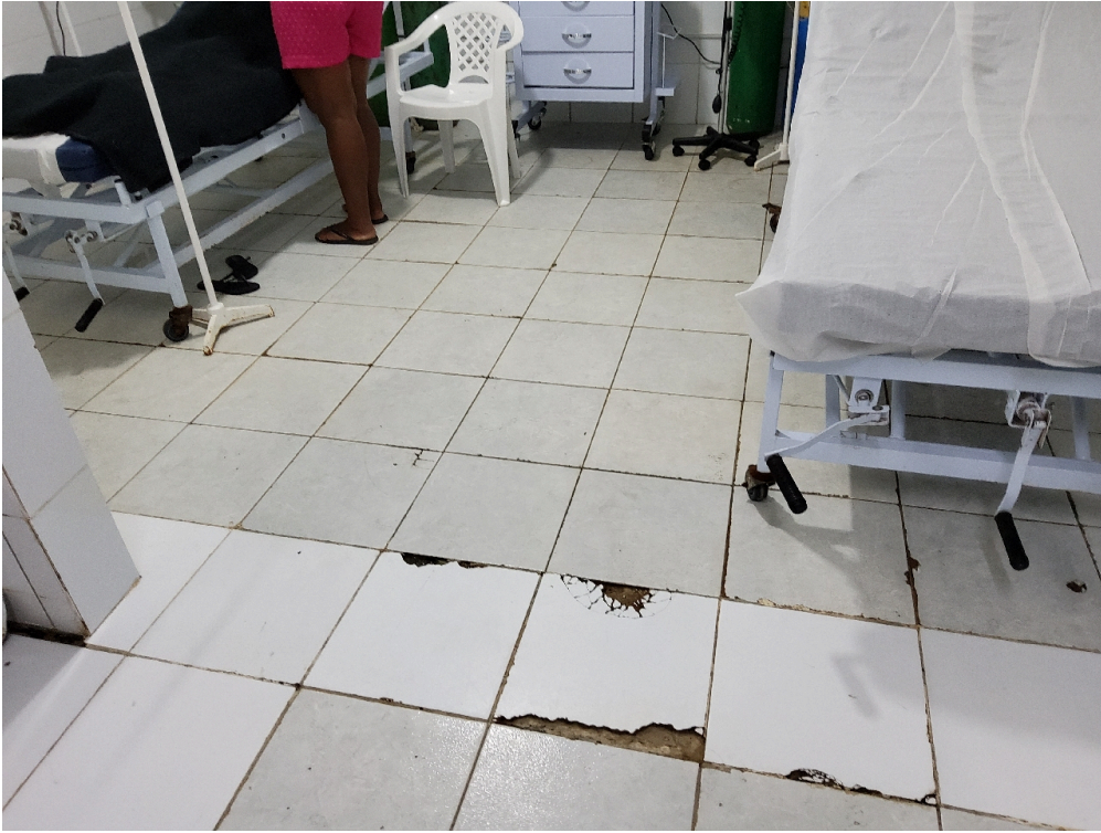
Conta com, no mínimo, duas macas/leitos