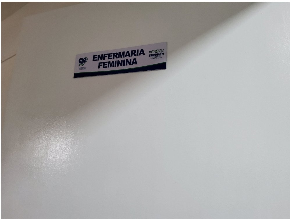
Respeita área mínima de 6m 2 /leito para enfermaria de 3 a 6 leitos