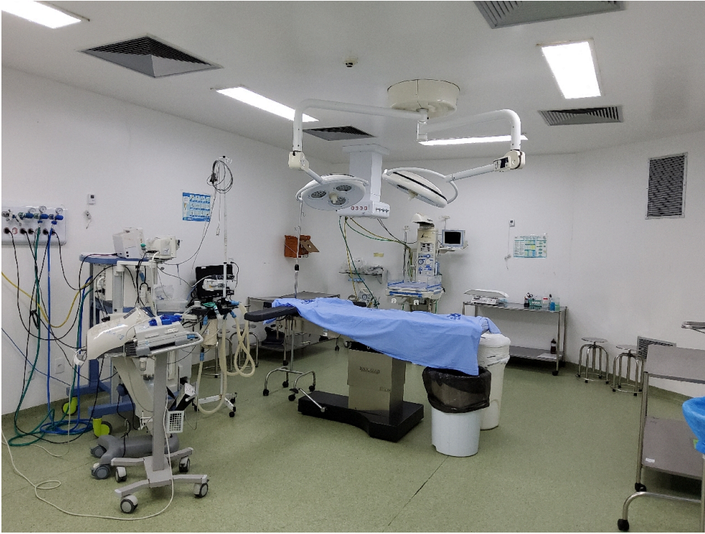
Sala de cirurgia 1 (obstétrica)