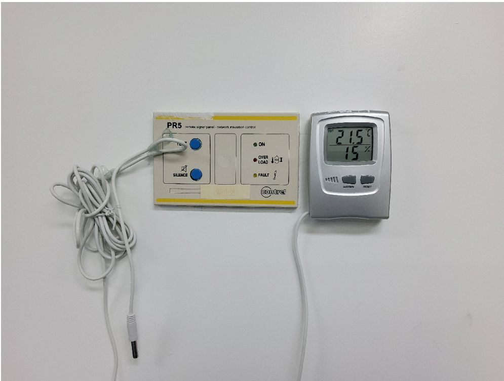
Termômetro sala de cirurgia 1