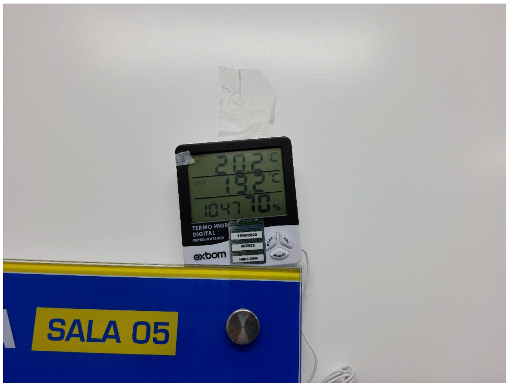
Termômetro sala de cirurgia 5