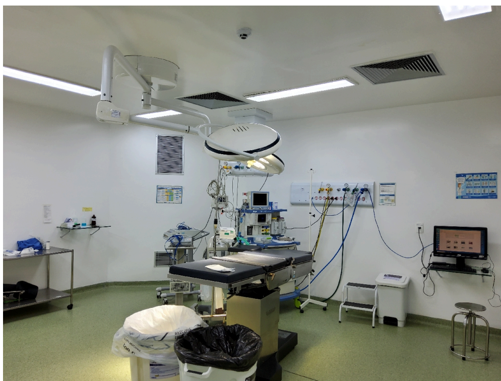
Sala de cirurgia 6