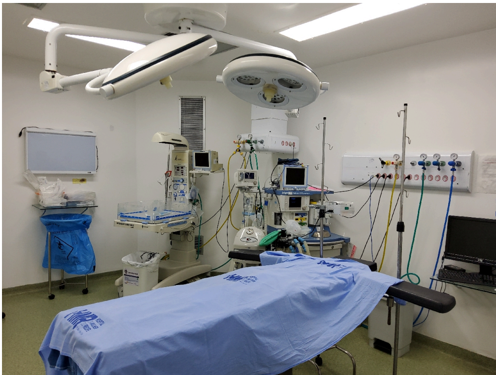
Sala de cirurgia 5