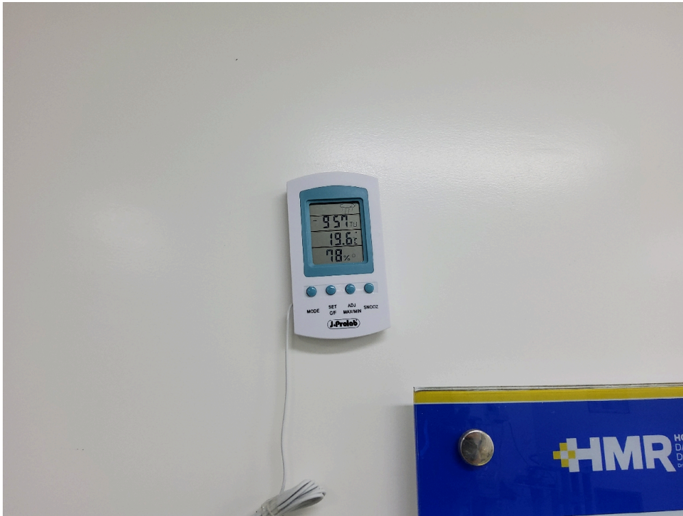
Termômetro sala de cirurgia 6