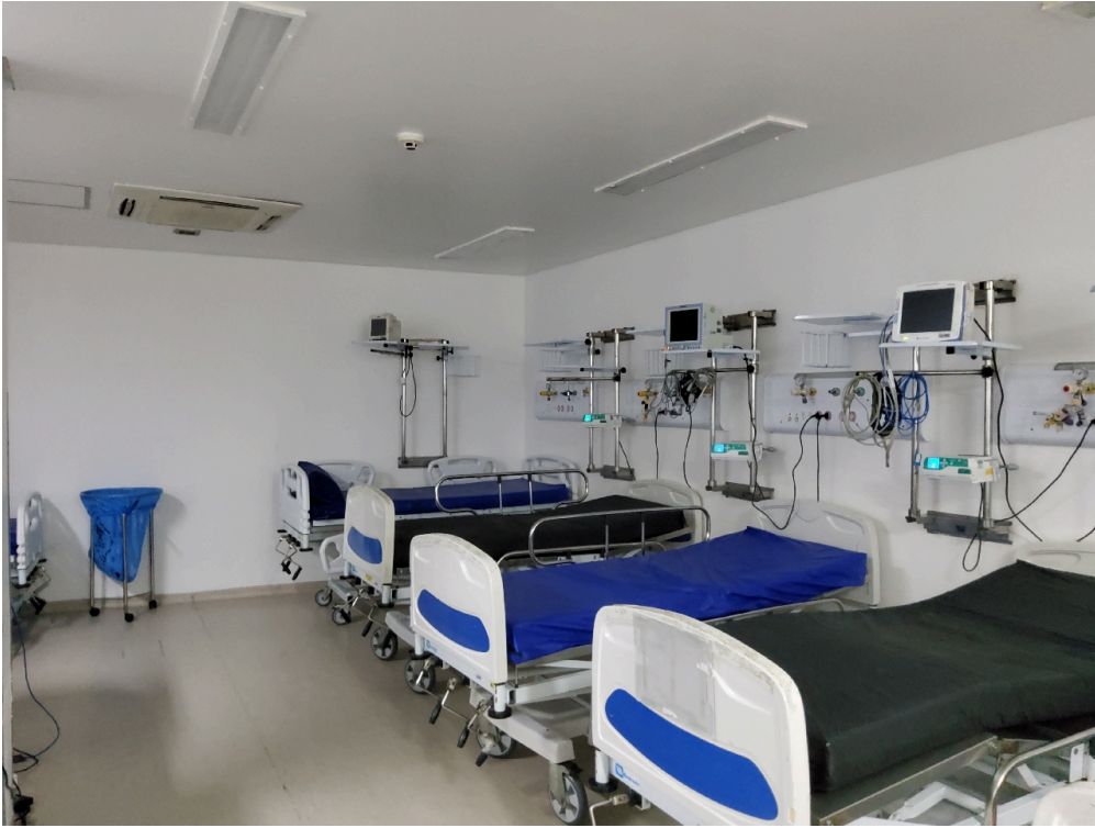
Sala de recuperação pós-anestésica