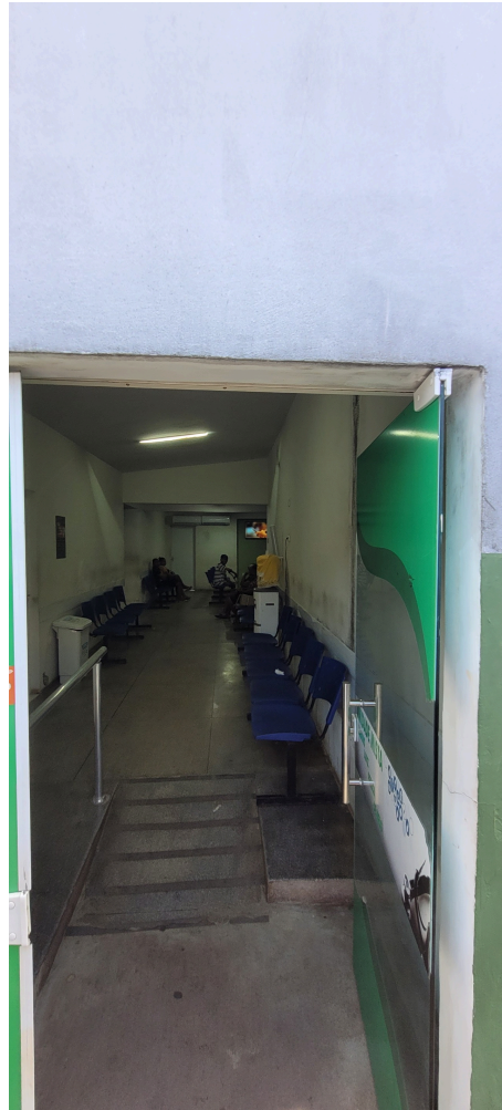
entrada dos pacientes para emergência