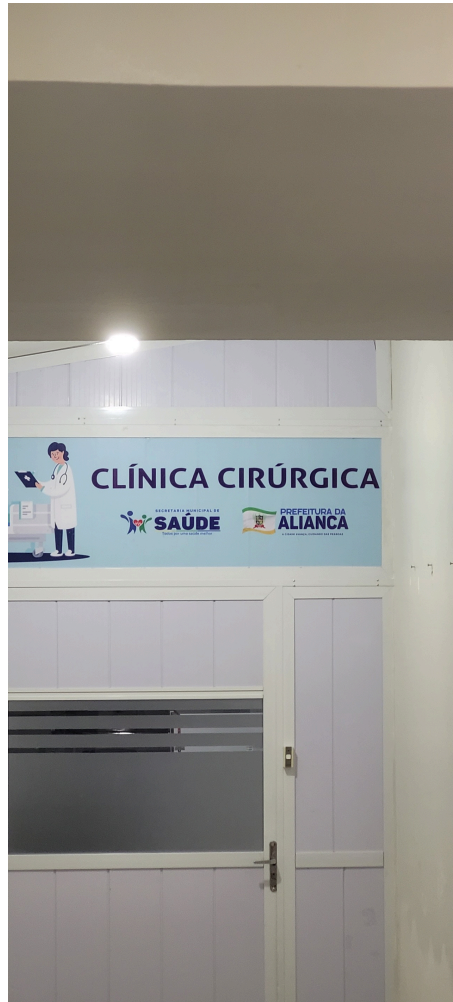
área de internação para paciente cirúrgicos eletivos