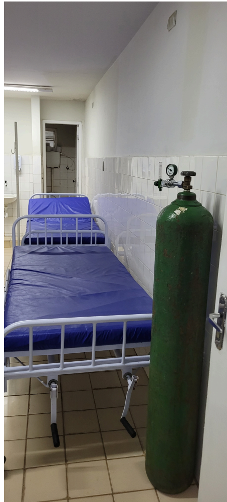
observação masculina com leitos vazios e banheiro anexo