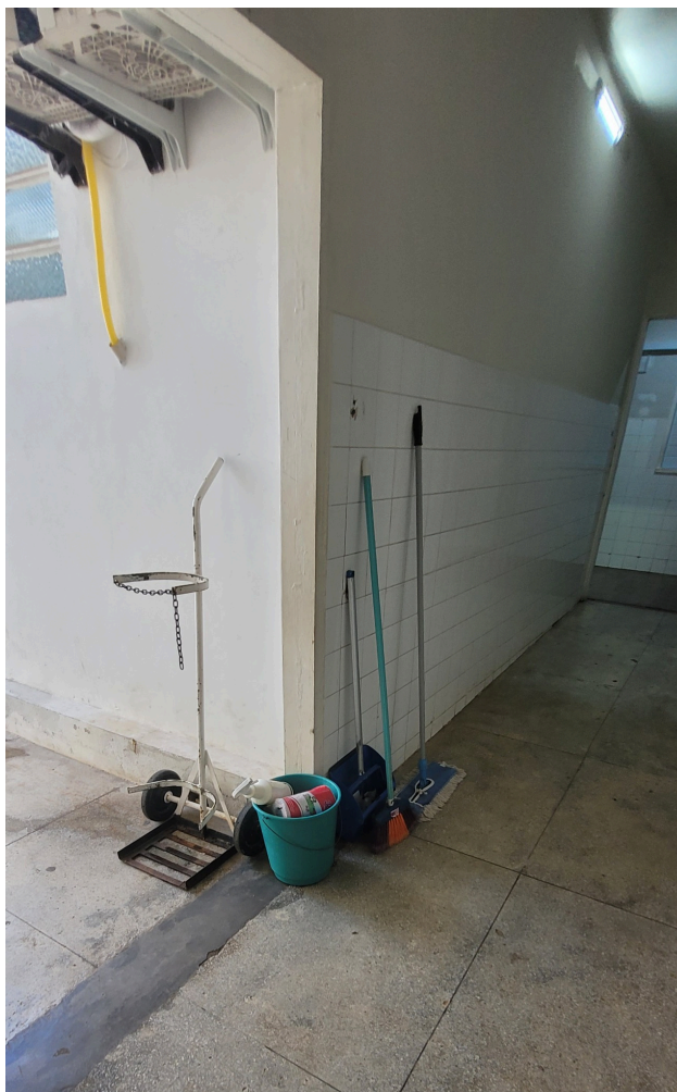
materiais de limpeza