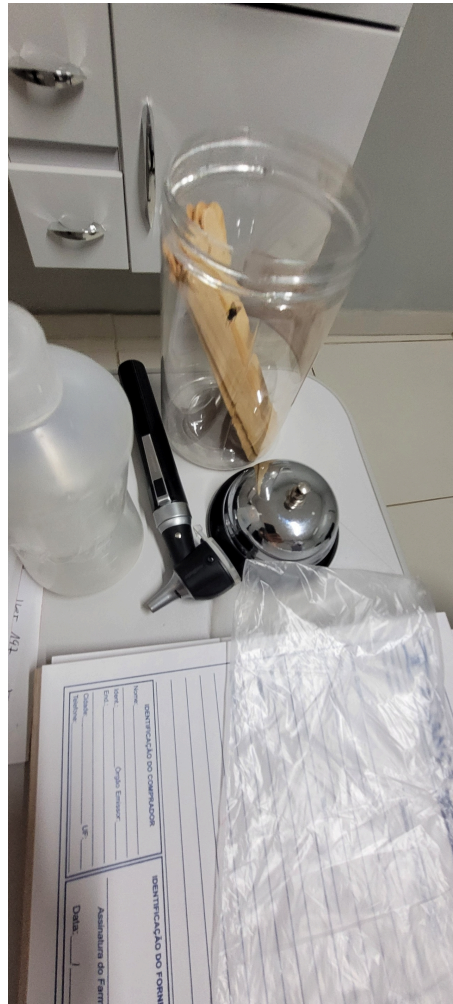
impresos, otoscópio e paletas descartáveis no consultório médico