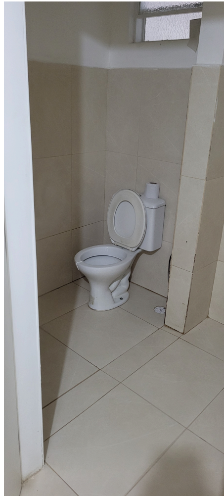
banheiro anexo na observação pediátrica