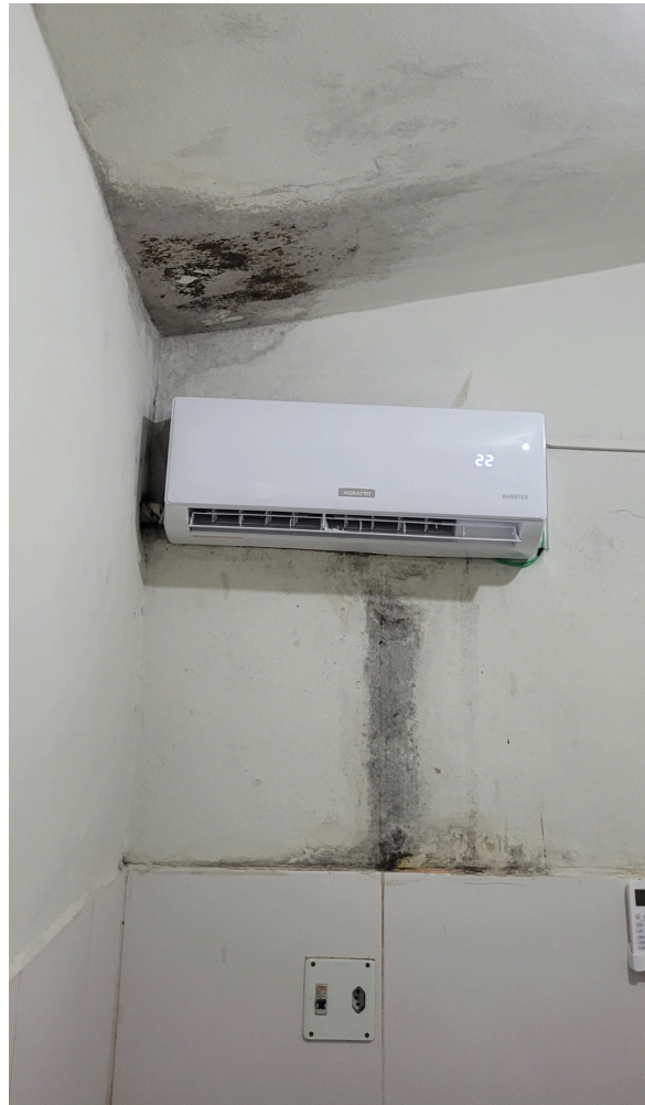
sala da triagem de enfermagem onde são aferidos sinais vitais com infiltrações e mofo próximo ao aparelho de ar condicionado