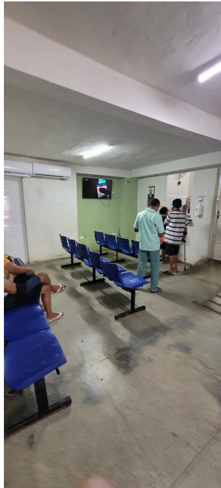
espera e recepção