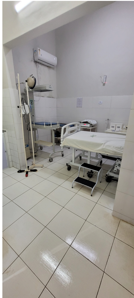
sala de parto