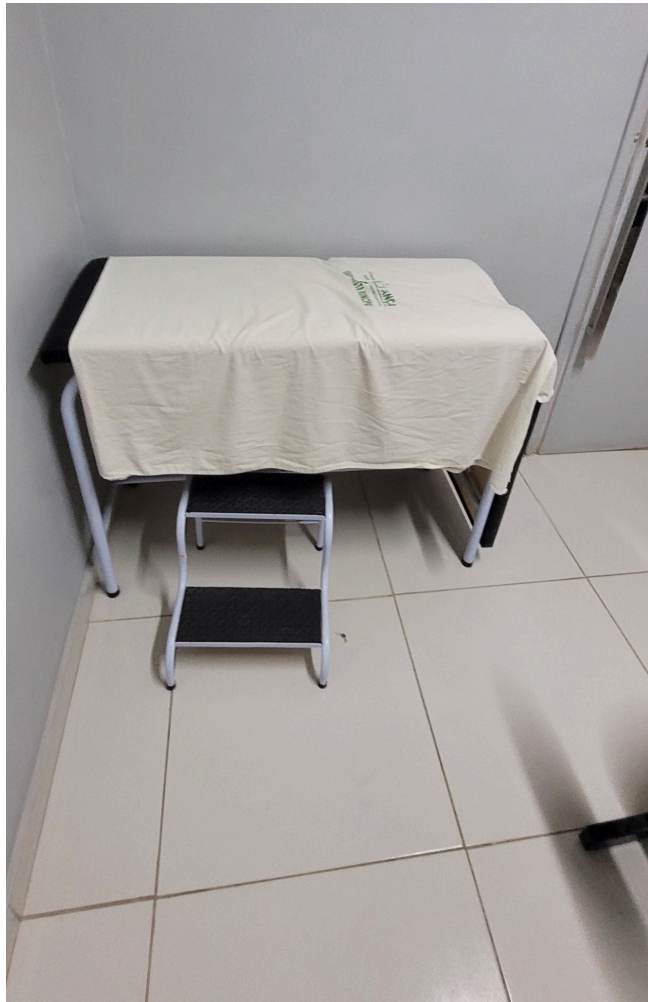
maca no consultório médico