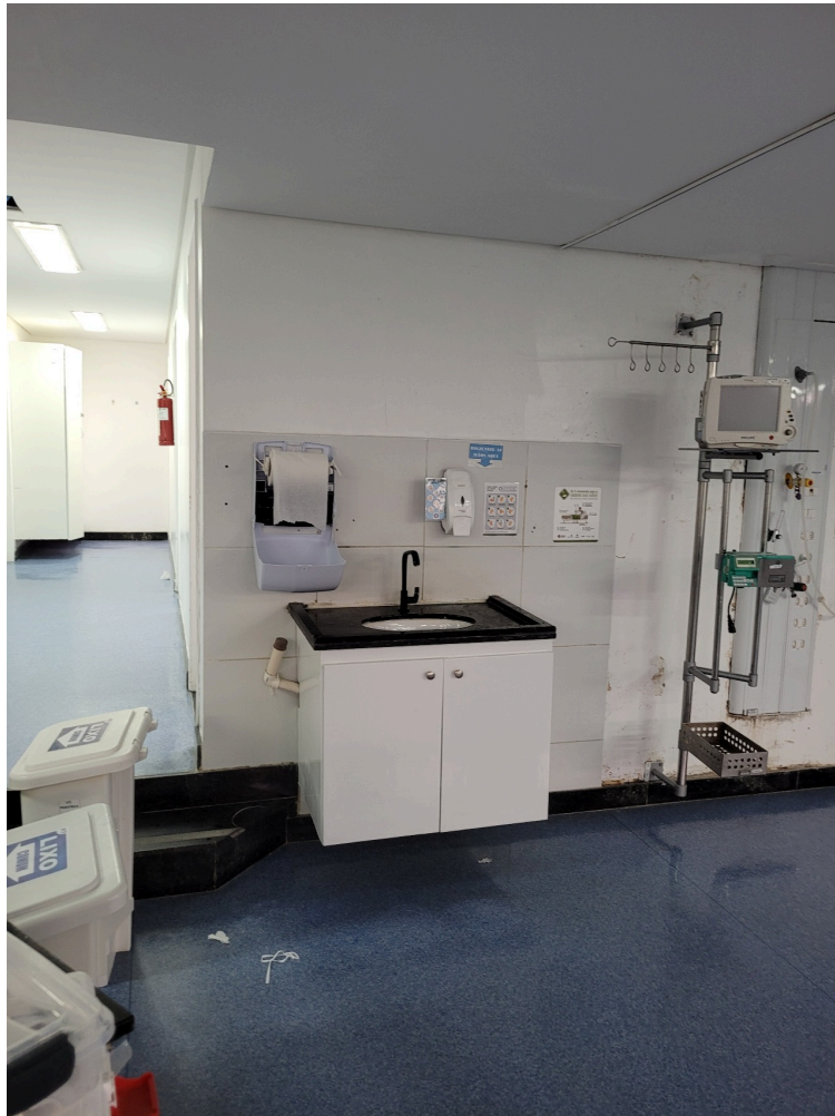
equipamentos da UTI pediátrica