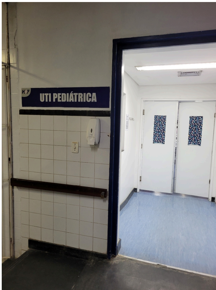
UTI pediátrica fica no quarto andar do Prédio Principal do hospital