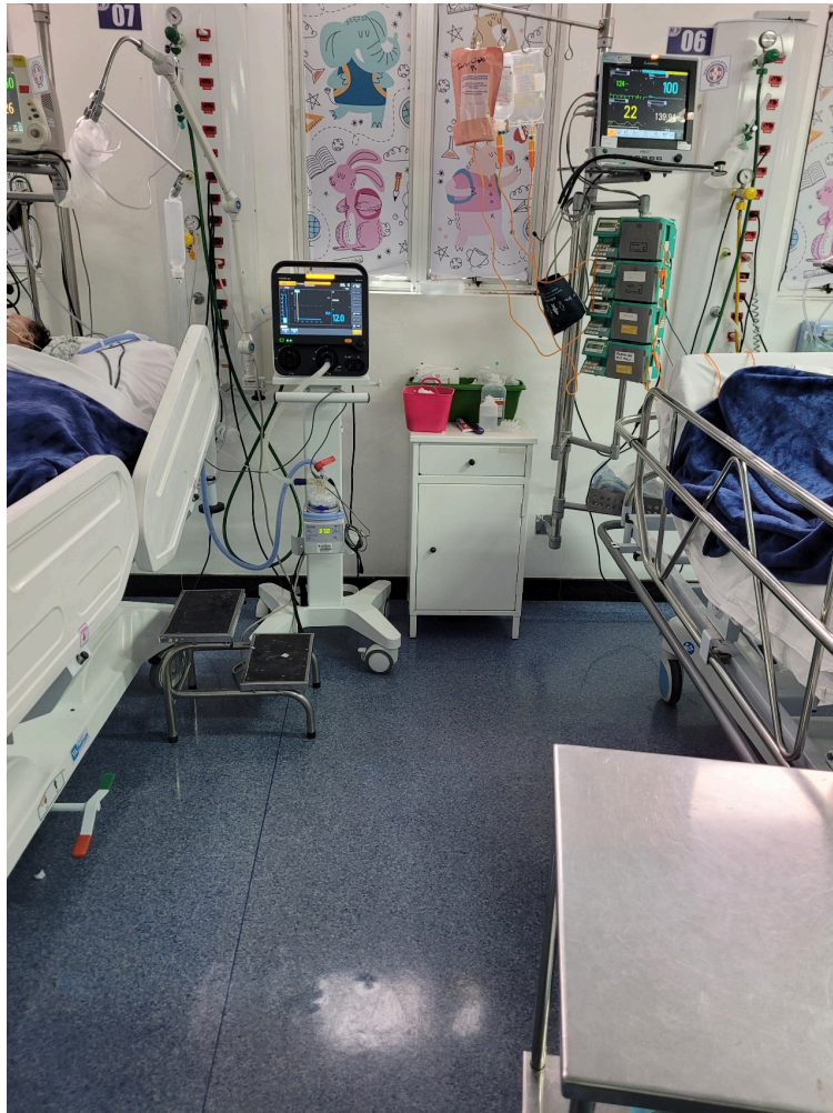
UTI pediátrica conta com 19 leitos equipados sendo dois leitos de isolamento